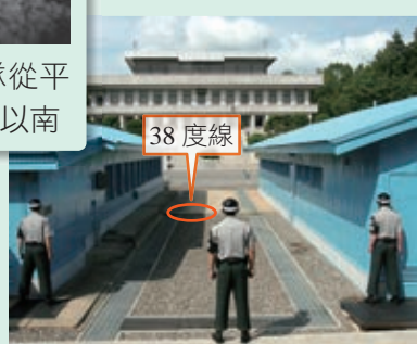
▲ 圖 2-8 板門店—目前的南北韓分界（中間隆起處即為北緯38度線）