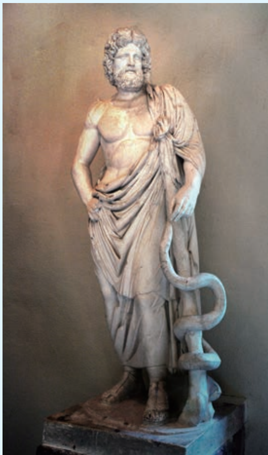
▲ 圖 3-6 羅馬醫療之神阿斯克勒庇俄斯，他所持的蛇杖代表著醫療，被現代許多醫療機構用於標誌之中。傳說在古羅馬曾經有瘟疫爆發，人民將化為巨蛇的阿斯克勒庇俄斯請來，瘟疫即因此消失

我們可以透過這本書窺探古羅馬時期的人是如何生活、訓練軍隊、致富，甚至於如何談戀愛。但由於以前能夠以文字記錄下來這些知識與奇聞軼事的人，大多還是以上層階級為主，因此我們目前僅能從現有的史料中，以從上而下的視角來理解羅馬的日常生活。這些日常生活看似瑣碎，卻在在體現了羅馬人對於哲學以及追求榮耀的實踐；有些故事看似荒誕奢靡，仍能反映羅馬帝國後期的經濟惡化以及社會問題。至於如何成為一個高貴的羅馬人？羅馬人為何能建立幅員遼闊的羅馬帝國？羅馬後期社會如何奢靡的生活？當你閱讀完這本書後，將會得到更多的答案。