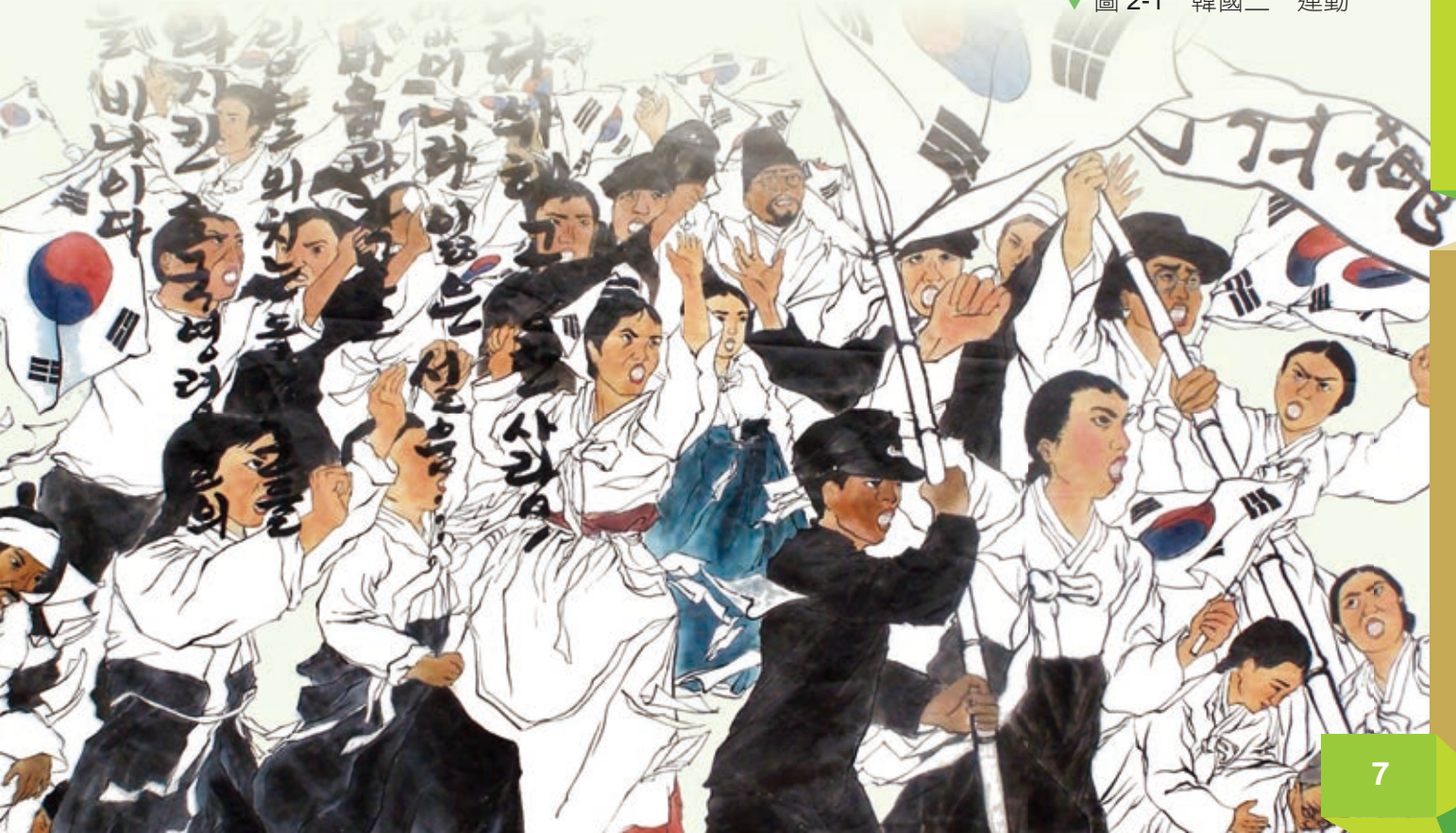
▼圖 2-1 韓國三一運動

1918年1月，第一次世界大戰即將結束前，美國威爾遜總統提出的十四點和平原則，其中「民族自決」的思想，在戰後得到當時殖民地人民廣大的迴響。1919年在韓國爆發了三一運動，韓國獨立人士在漢城的明月館宣讀了獨立宣言，同時在漢城「塔城公園」及朝鮮半島各地引發了反日抗爭與遊行，遭到日本軍警鎮壓。據統計，死傷人數至少有一千四百人。由於運動遭到壓制，各個韓國獨立黨派轉往上海，成立了大韓民國臨時政府。此年也被稱為大韓民國元年，此後一直為臨時政府使用到1948年為止。