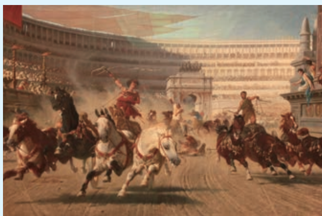
▲ 圖 3-4 畫家 Alexander von Wagner 於 1882 年繪製戰車比賽的場景