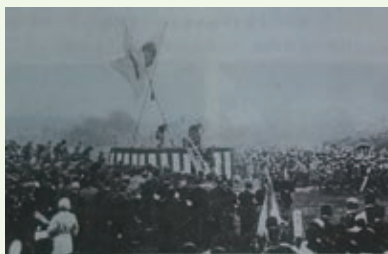
▲ 圖 2-3 虹口公園爆炸後現場