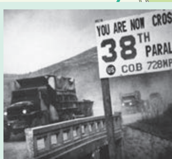
▲ 圖 2-7 聯合國部隊從平壤撤退到第38度線以南