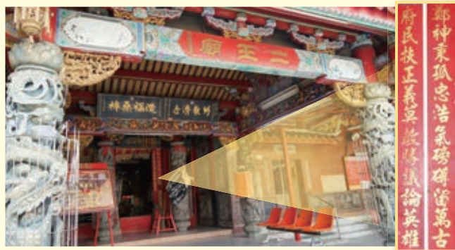
▲ 圖 1-5 鄭經主政東寧王國 19 年，並曾西征大陸，雖敗猶榮。鄭經死後，百姓在東安坊建二王廟紀念，今已湮滅。目前最著名的二王廟位於臺南永康區，奉祀鄭經神像

果然不到三天，野心勃勃的馮錫範，就聯合鄭經之弟鄭聰等人，向董太妃進讒，聲稱克塽並非王室血脈，要求罷黜克塽。董太妃早已嫌惡克塽之母，於是在眾人的鼓動下，下令收回監國印璽，克塽不服，親往北園別館晉見太妃，卻被鄭聰等人以武力加以囚禁。鄭聰為免夜長夢多，當夜就密令配備火鎗、憨忠的「烏鬼兵」（荷蘭人留下的班達島黑奴）殺害了克塽。