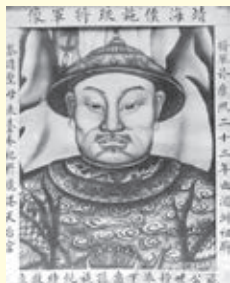
▲ 圖 1-8 施琅平定臺灣立下大功，為避免皇帝猜忌，將澎湖海戰的獲勝歸功於媽祖顯靈，於是上奏建議將媽祖由天妃晉升為天后，獲得康熙皇帝批准。同時施琅也從福建湄洲媽祖祖廟迎來一尊千年黑面媽祖神像，供奉於鹿港天后宮

鄭克塽得知澎湖失守，內心驚恐，隨即召集會議。會中有人激動嚷著死守臺灣，也有人主張南取呂宋，再建基業。會議在吵鬧聲中落幕，但劉國軒內心已經決定投降，他將主張出兵呂宋的將領調離，又派人看管鄭氏及明室的王族，以防逃脫。七月，鄭克塽向康熙皇帝呈遞降表，稱臣納土，馮錫範、劉國軒等文武官員也雍髮結辮降清。至此東寧王國滅亡，共三代二十三年。