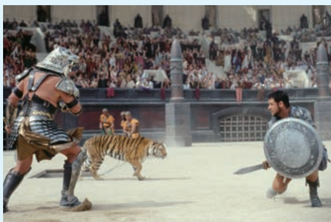
▲ 圖 3-3 電影《神鬼戰士》劇照，角鬥士必須依據情況與野獸或是戰士搏鬥，而坐在觀眾席的民眾，則須依據社會地位高低入座，地位越低位置越上層

誇張的行徑不只呈現在競技場上，在羅馬貴族的餐桌上看到上千種的佳餚美食絕不稀奇。不僅常常從下午吃到午夜，賓客還會運用羽毛伸進喉嚨或吃催吐藥催吐，讓自己可以吃下更多的奇珍佳餚（註3）。羅馬人自己也意識到社會風氣的改變，並諷刺地在賭桌的棋盤上寫下警語，然而這些警語已經無法讓羅馬社會再回到以前純樸、節制的農業社會。戴克里