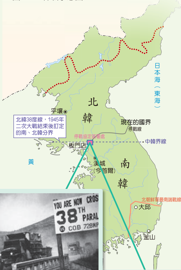
▼ 圖 2-6 韓戰示意圖

李範奭、金弘壹、金九之子金信等人。但蘇聯解體後的1992年，韓國與我國斷交，並且將駐韓大使館建築及相關財產直接移轉給中華人民共和國。當時在臺灣民間爆發強烈的反韓遊行，政府方面也以斷航作為主要的報復手段。2000年以後，雙邊的緊張關係日漸趨緩，臺韓航線也於2005年復航。隨著韓國流行文化在臺灣的風靡，大多數民眾不再對韓國有強烈的反感。回顧中華民國與韓國獨立運動的這段歷史，對將來與韓國的關係，究竟是資產或是負債，值得我們省思。