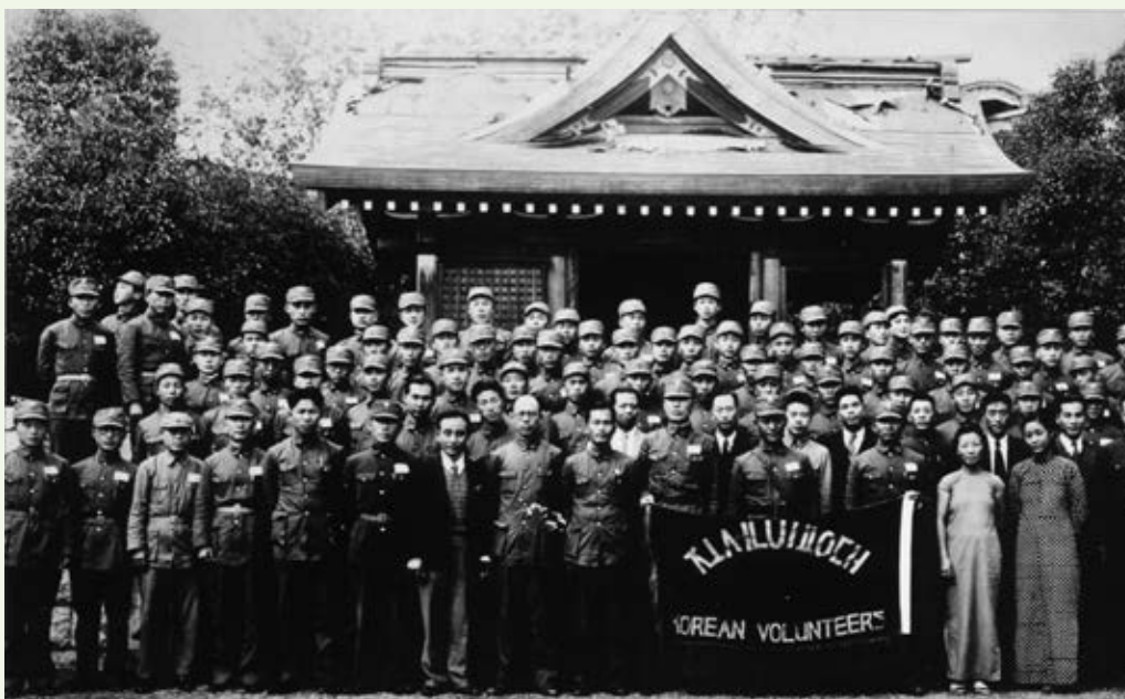
▲ 圖 2-4 朝鮮義勇隊