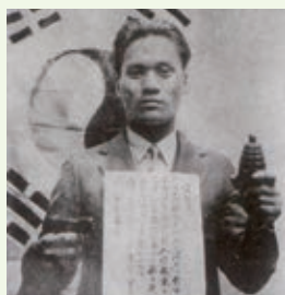
▲ 圖 2-2 尹奉吉執行炸彈攻擊前，在國旗前宣示

由於武力為獨立革命所不可或缺，不少韓國青年投身中國陸軍軍官學校（黃埔軍校）就讀，以學習到的軍事知識促進韓國獨立。1938年朝鮮義勇隊成立；1940年韓國光復軍成立，由李青天擔任總司令，李範奭（音ㄋㄢˋ，ㄙㄨㄛˋ）任參謀長。朝鮮籍日軍或軍俘在逃離或被國軍俘虜後，會由國民政府轉交給光復軍。由於光復軍人數不多，所從事的多為輔助性的工作，如宣傳、蒐集情報、翻譯、管理戰俘等等。1945年日本投降後，光復軍獲得國民政府認可，組織日軍朝鮮籍戰俘，人數達到五萬人。但由於占領朝鮮半島的美軍拒絕讓這批部隊入境，光復軍只能解散組織以個人身分入境。因此戰後的大韓民國軍隊，則由舊日軍軍校出身者為主軸，如白善燁、丁一權等等。光復軍出身者地位雖高，但由於美軍排擠，及軍事學術較日軍出身者不足，故無法成為韓國軍隊的主導者。1949年時尚有50名韓國學生還就讀成都的陸軍官校第23期，並且願意在國民政府服務，日後再