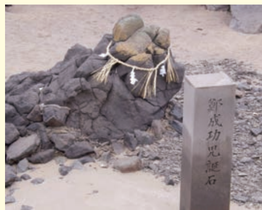
▲ 圖 1-2 鄭成功的出生地位於日本長崎縣平戶市，當地為其豎立紀念碑