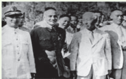
▲ 圖 2-5 蔣介石造訪韓國，與韓國總統李承晚會談

在冷戰期間，在臺灣的國民黨政府一直與大韓民國朴正熙政權維持長久的友好關係。早期的韓國駐華大使不少都曾為韓國臨時政府或光復軍人士，如