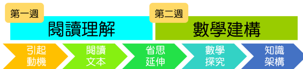
圖 1、數學×文學的跨領域課程架構圖

這套跨領域的課程挑選了《超展開數學教室》以及《超展開數學約會》這兩本書中的八篇文章做為課堂的文本，每篇文章分別進行二週時間（包含一週的「閱讀理解」以及一週的「數學知識建構」），共計十六週的課程，其課程操作的架構圖如圖 1：