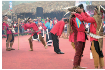
圖1-2 鄒族成年禮，由長老為接受成年禮的男子戴上皮帽，象徵成為部落的成年人。

傳統的成年禮因民族與地域的不同而各具特色，綜合來說，多藉此禮儀向青年傳授歷史知識、生產技能和風俗習慣，尤其「通過儀式」代表成員必須經過身分轉化的歷程，才會被認定為成年人，取得新成員地位的認可。而上一代的長輩也趁此機會向下一代宣告，從此必須建立社會責任感，為自己的行為舉止負責。