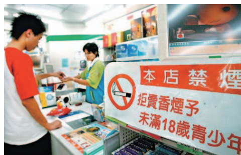
圖1-6 為保護未成年人，常有許多規定與限制。