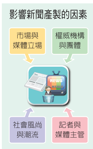
圖3-2 能成為媒體所報導的新聞素材，必定有其重要的特性。

以上可知，媒體選取新聞的來源很多，影響新聞產製的因素也不少，正說明了新聞產製是相當複雜的。