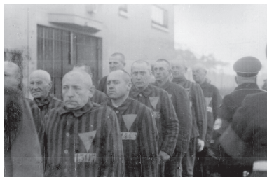
圖2-1 德國納粹政權以集中營的方式，殺害數百萬猶太人。

進一步檢視殖民地人權為何需要受到保障，其原因在於殖民地政府掌握軍隊、警察、司法系統等，政府擁有極大的權力，若沒有合法的運用權力，將可能對人權造成極大的侵害與壓迫。例如：政府以非法羈押、逮捕、拘禁等手段來剝奪人民自由或生命，當殖民地人民的基本人權受到殖民地政府嚴格的監控與限制，人民不僅無言論自由、人身自由，甚至連生命權都可能遭受國家的剝奪。