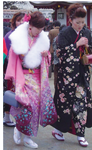
圖1-3 日本成人節，這一天全國放假。年滿20歲的男女青年都要身穿盛裝，參加各級政府為他們舉辦的成人儀式。