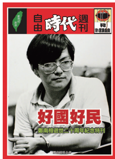
圖2-2 鄭南榕以自焚的激烈手段爭取言論自由。圖為鄭南榕逝世20週年紀念特刊。

歷史的教訓是殘酷的，我們必須從中學習到權利保障的重要。今日人權雖大有進步，但世界上仍有國家因宗教或政治等因素，拘禁與國家理念不同的異議分子，這使人權蒙上了一層陰影。總而言之，我們必須重視人權、避免政府蔑視人權、讓政府權力受到憲法和法律的 限制 ，如此才可防止恣意侵害人權的悲劇重演。