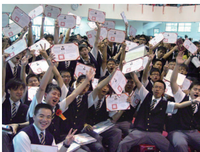
圖1-5 高中畢業典禮就是一個人生的重要分水嶺。

不論是成年禮的儀式，或是法律對成年人的要求，都是為了讓我們了解成年後享有的權利與承擔的義務已經改變，要獨立自主，對自己的言行負責。成年禮的儀式雖然只是一時，但代表的意義，卻是終生的。若能將傳統成年禮的禮俗結合新時代的見解與轉化，把成年禮的儀式轉化成一種社會教育，協助青少年認識自己、適應環境，做好成為成年公民的準備。