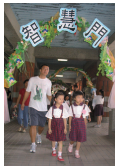
圖 1-1 每個社群會設計通過儀式，以幫助成員能在生命轉折時，從原來的身分與角色平穩順暢地轉移到另一身分與角色。小學在新生入學時設計的歡迎儀式，即為此種作用。

高中生即將邁入成年階段，應該對於通過儀式，尤其是成年禮，有所認知了解，以下介紹傳統的通過儀式與各種不同的成年禮。